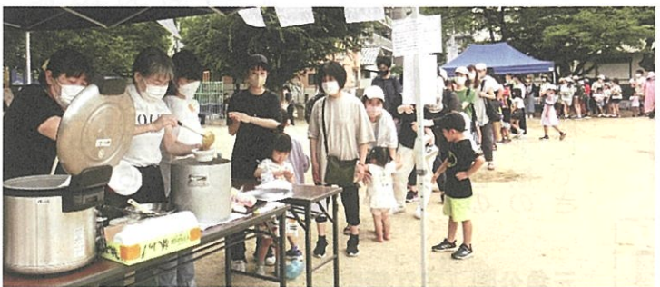
ながーい行列 「いちじく食堂」さんがカレーをふるまいました