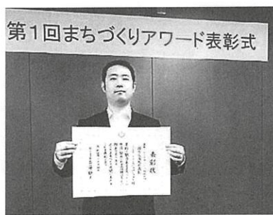
第1回まちづくりアワード表彰式