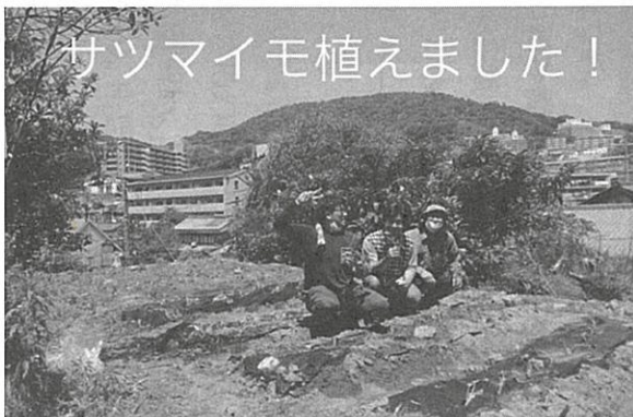
サツマイモ植えました！

「空いている土地があるから地 域で楽しめるように使って」と 町内の方からのご厚意を受け、 学区内某所にて、町内会役員 の一部メンバーで少しずつ畑な どを作っております。 5月に少しですがサツマイモの 苗を植えました。 これからも少しずつ耕し、他の 野菜なども育てたりして地域の 皆さんとで楽しめる場所にでき たらと考えています。